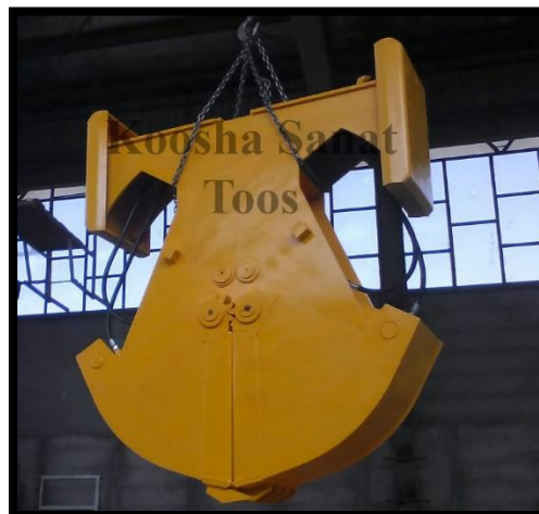
گراب حفاری-یک دستگاه-مشتری: قطار شهری مشهد