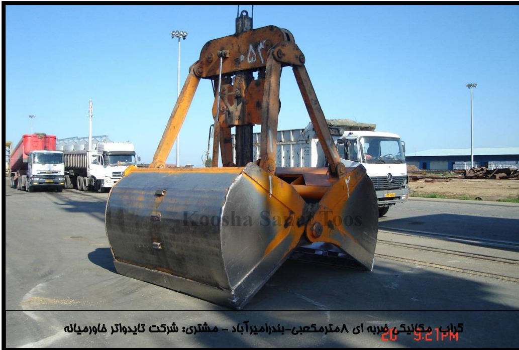
گراب مکانیکی ضربه ای ۸ مترمکعبی- بندر امیرآباد - مشتری: شرکت تایدواتر فاورمیانه