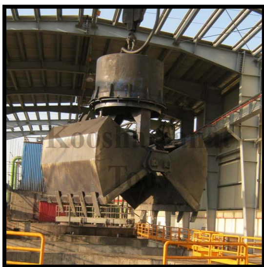
گراب لایروبی مترمکعبی موضبه فولادسازی- مشتری: شرکت درپاد آذربایجان

عموما جهت لایروبی حوضچه های صنایع فولاد از این نوع گراب استفاده می شود. این نوع گراب بطور معمول با ظرفیتهای مختلف از ۰,۳ مترمکعب تا ۳ متر مکعب قابل ساخت می باشد.