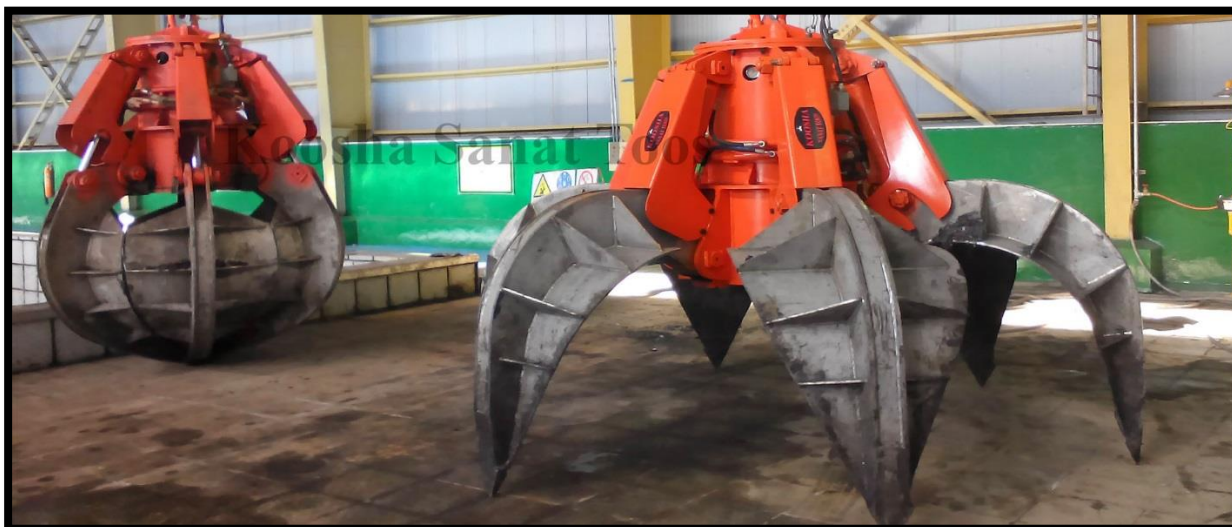
گراب هیدرولیکی موتوری اورنج پیل- مشتری: شرکت کوشا تجهیز پاسارگاد جهت صنایع شهید عارفی

چنگک هیدرولیکی مخصوص جابجایی انواع پلیسه و قراضه های فلزی و ضایعات بازبافتی، زباله ها و قطعات درشت، قلهه سنگها و شارژ کوهها می باشد.