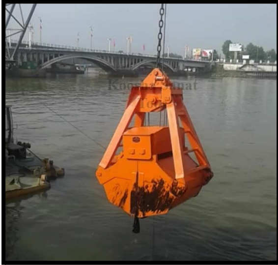
گراب مکانیکی لایروب دو طنابی- ۲/۷ مترمکعبی- بندرانزلی مشتری: اداره بنادر و دریانوردی گیلان

گرابهای لایروب مکانیکی جهت لایروبی اسکله ها و حوضچه ها و رودخانه ها استفاده می گردد که بایستی از جرثقیل دو وینچ استفاده گردد.