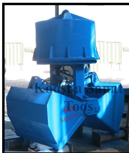
گراب لایروبی مترمکعبی موضبه فولادسازی- مشتری: صبا فولاد زاگرس