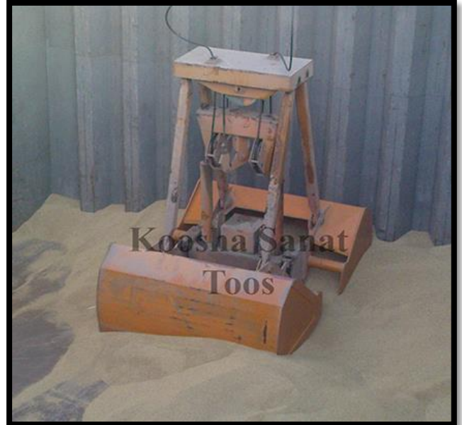
گراب کنترل از راه دور ۸ متر مکعبی - بندر امیرآباد - ۳- دستگاه - مشتری : شرکت تایدواتر فاورمپانه