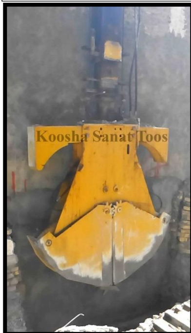
گراب حفاری-یک دستگاه-ایجاد دیوار دیافراگمی جهت مجتمع سازی

این نوع گراب جهت گود برداری و ساخت دیوار دیافراگمی در پروژه های عمرانی استفاده می شود. با استفاده از این تجهیز هنگام گود برداری خطر ریزش دیواره های جانبی از بین می رود و با ایمنی بالایی می توان حفاری را انجام داد.