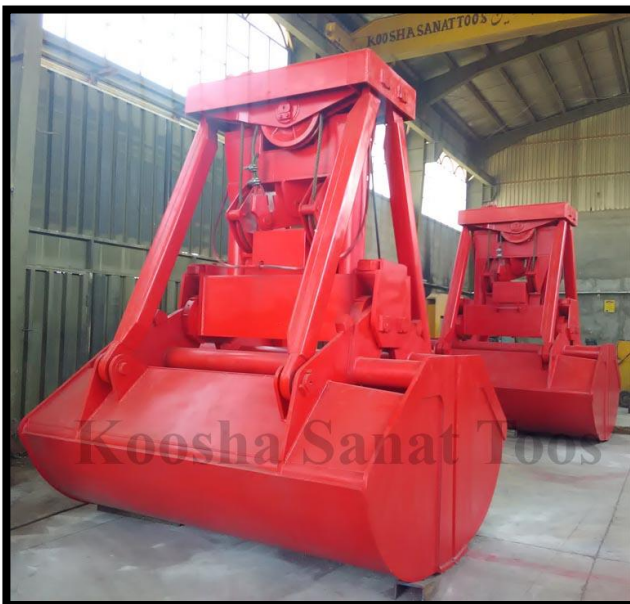
گراب کنترل از راه دور ۵,۴ متر مکعبی - بندر انزلی - ۲- دستگاه - مشتری : خدمات دریایی سینا