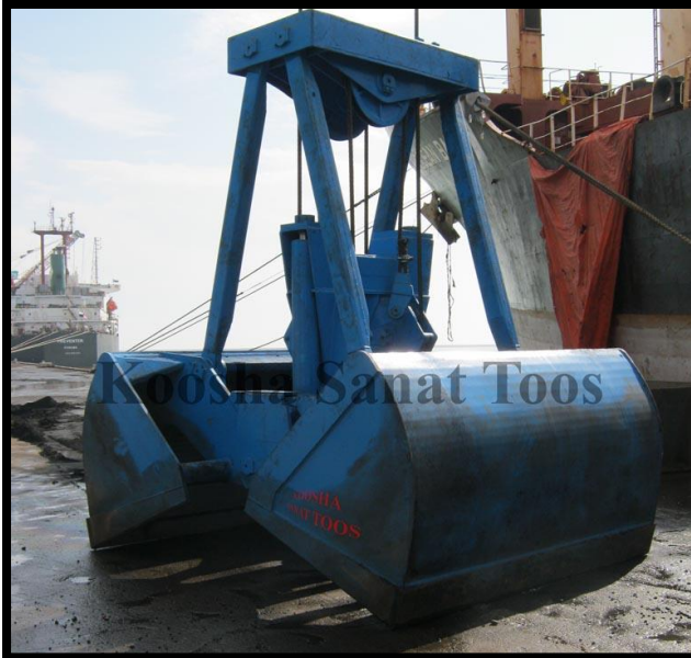
گراب کنترل از راه دور ۸ متر مکعبی - بندر امام خمینی - ۴- دستگاه-

جهت جابجایی انواع مواد فله با دانسیته های مختلف بوده و بدلیل اینکه از امکانات جرثقیل منفک است ، با هر نوع جرثقیل قابل استفاده می باشد. این گراب روی انواع جرثقیل نصب می شود و فرمانهای بارگیری و تخلیه توسط ریموت کنترل و توسط اپراتور به راحتی اجرا می گردد. این نوع گراب برای اولین بار در ایران توسط شرکت کوشا صنعت توس طراحی و تولید شده است،