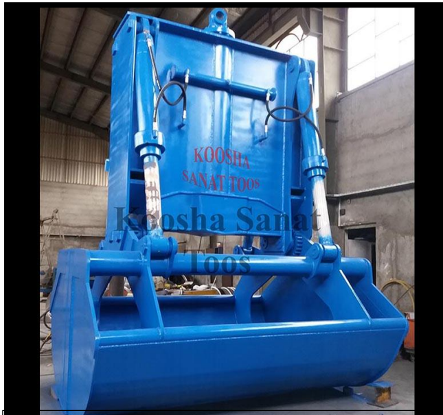
گراب هیدرولیکی پاکتی ۸ مترمکعبی-کنگان -یک دستگاه-

شرکت کوشا صنعت توس این افتخار را دارد که محدوده وسیعی از انواع گراب ها را در مدل ها و سایز های مختلف و بر اساس خواسته مشتریان تولید و ارائه نماید. این نوع گراب دارای دو نوع مختلف می باشد که بسته به مورد استفاده آن ساخته می شود.