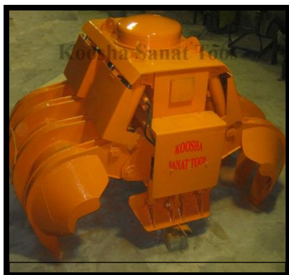
گراب هیدرولیکی موتوری مستطیلی جهت ممل قراضه مشتری: شرکت Amesco

چنگک هیدرولیکی مستطیلی مخصوص جابجایی ضایعات درشت و قراضه ها، تخلیه و بارگیری کشتی، واگن، کامیون و... می باشد..