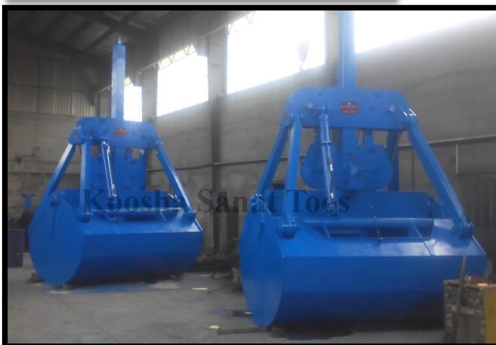
گراب مکانیکی ضربه ای ۷ مترمکعبی- ۳ دستگاه- بندرانزلی

این نوع گراب جهت جابه جایی مواد با چگالی پایین استفاده و با هر نوع جرثقیل قابل استفاده می باشد. یکی از مزایای این نوع گراب سهولت استفاده آن برای اپراتور می باشد.